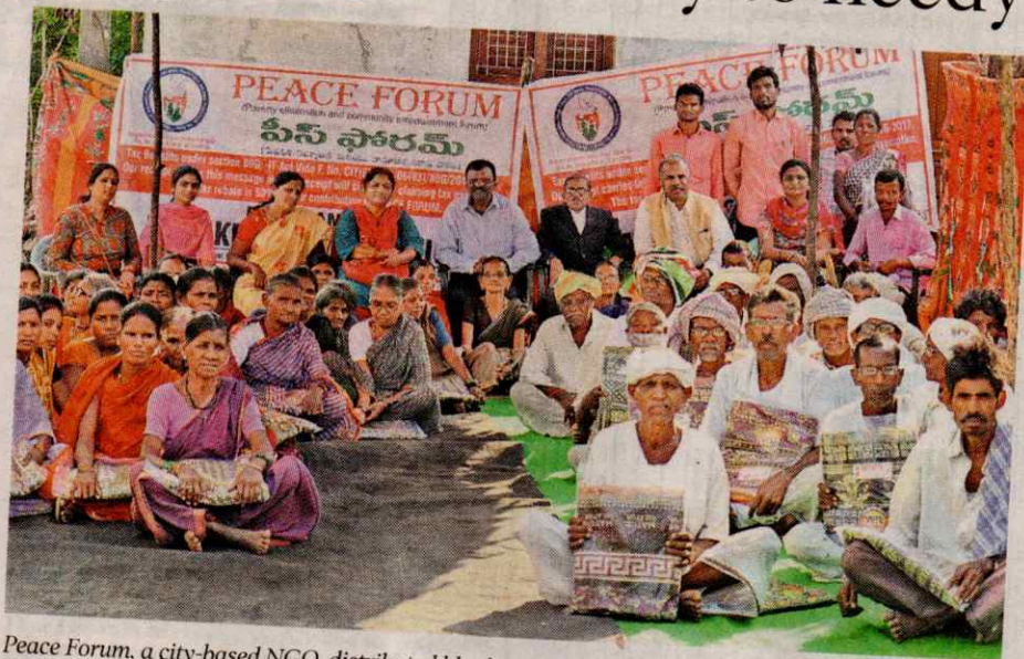
Peace Forum, a city-based NGO, distributed blankets in the villages of Adilabad mandal.