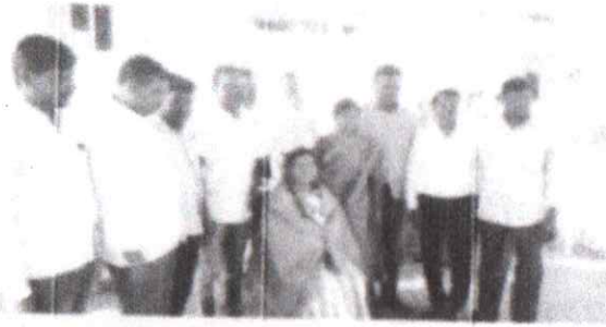
ఎంపీడిఓను సన్మానిస్తున్న పీస్ ఫోరం సభ్యులు